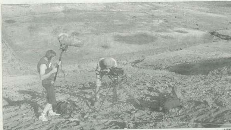
Momento de la grabación de Holidays , en Lanzarote.